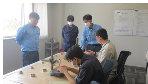
寸法測定体験実習