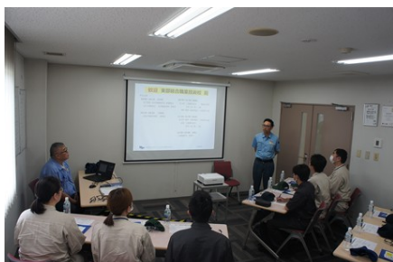
会社概要について