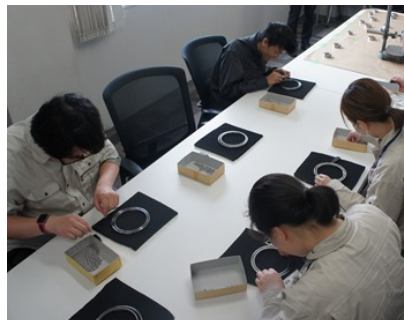
総ボール軸受組立て体験実習