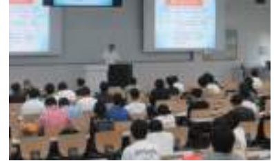
関東学院大学理工学部講義

講義は、社会人として資質を陶冶するために学生時代にやるべきこと、また就職活動に備えて、良き会社の選び方を会社