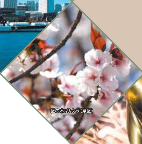
区の木:サクラ(泉区)