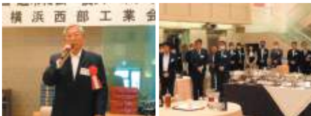
5月18日(木)、於：天王町モンテファーレ

総会は机上の議案配布資料に基づき、事務局説明があり議長より決議を諮ったところ、議案は異議なく拍手多数で承認されました。