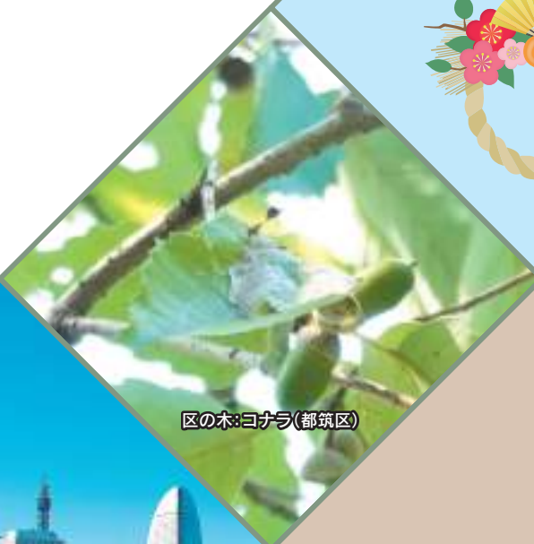
区の木:コナラ(都筑区)