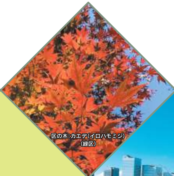
区の木:カエデ(イロハモミジ) (緑区)