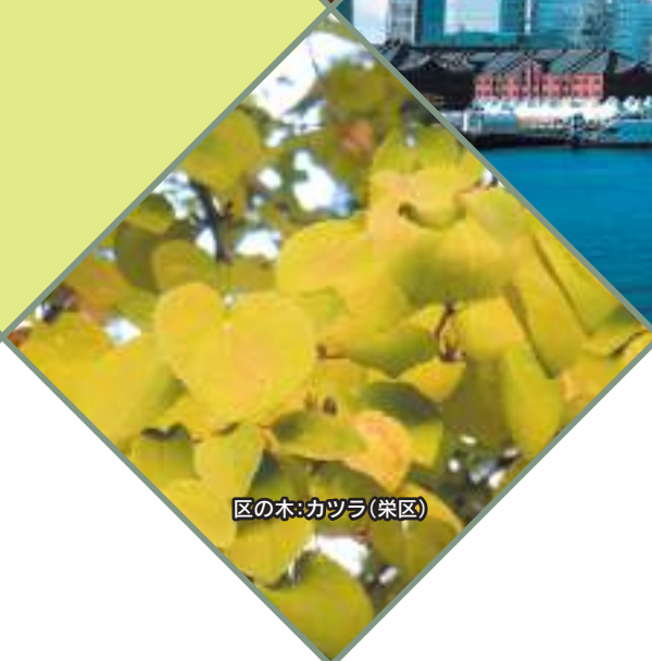
区の木:カツラ(栄区)