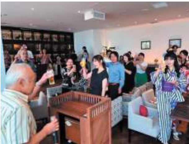
家族親睦会：オリエンタルビーチ写真