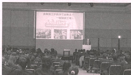
昨年の講演の様子