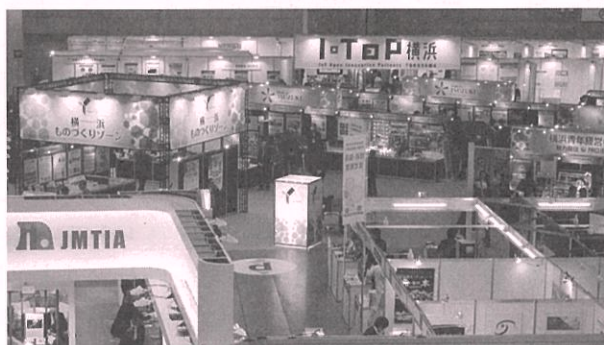
昨年の展示会場の様子

「ロボット特設」: 産業用や生活支援などのロボットに関する技術・製品について紹介。