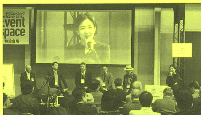
ミニフォーラムの様子

金沢臨海部の新たな名称は、地域の認知度とイメージのアップを図り、産業団地の活性化、特に人材採用