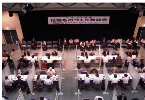
受・発注商談会（川崎会場）の様子

この度、関係団体との連携により、次のとおり開催いたしますので、ぜひ、ご参加くださいますようご案内申し上げます。