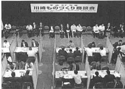
昨年度 川崎ものづくり商談会の様子

この度、新たな取引先をお探しの発注企業の皆さまを対象に、本商談会への参加企業を募集することといたしましたので、お知らせします。