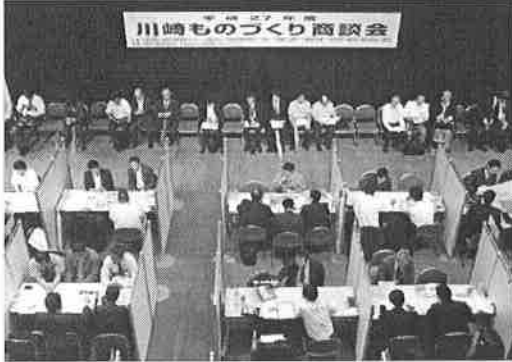
昨年度 川崎ものづくり商談会の様子

この度、新たな取引先をお探しの受注企業の皆さまを対象に、本商談会への参加企業を募集することといたしましたので、お知らせします。